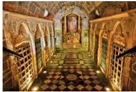
כנסיית הבשורה האורתודוקסית