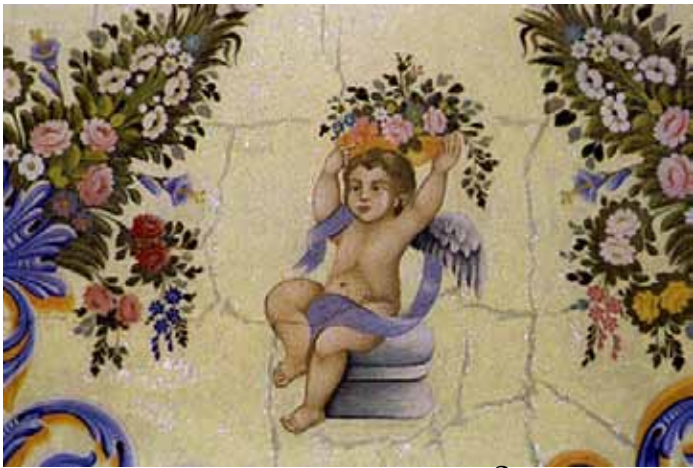
אואנת ותקרית אזליות